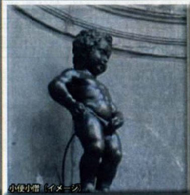
小便小僧 (イメージ)