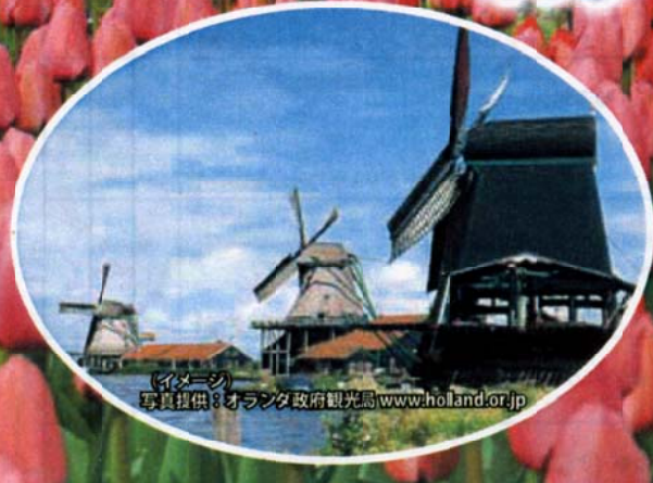
(イメージ)

※別途料金(目安): 燃油サーチャージ21,000円、現地空港税2,700円、航空保険600円、成田空港施設使用料2,540円などを別途請求させていただきます。(2010年12月現在) ※空港税・燃油サーチャージなどの新設または税額が変更された場合、追加徴収となります。