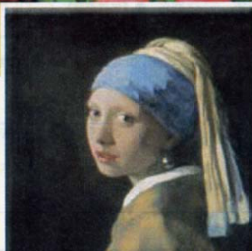
フェルメール「真珠の耳飾の少女」(イメージ)