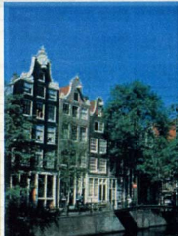
運河 (イメージ)