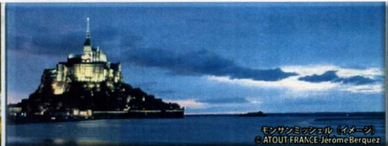
モンサンミッシェル (イメージ)