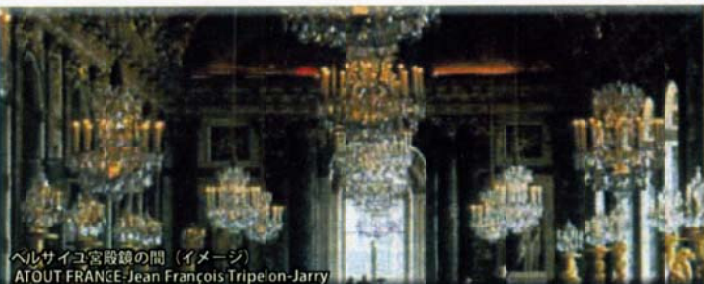
ベルサイユ宮殿の間の間 (イメージ)